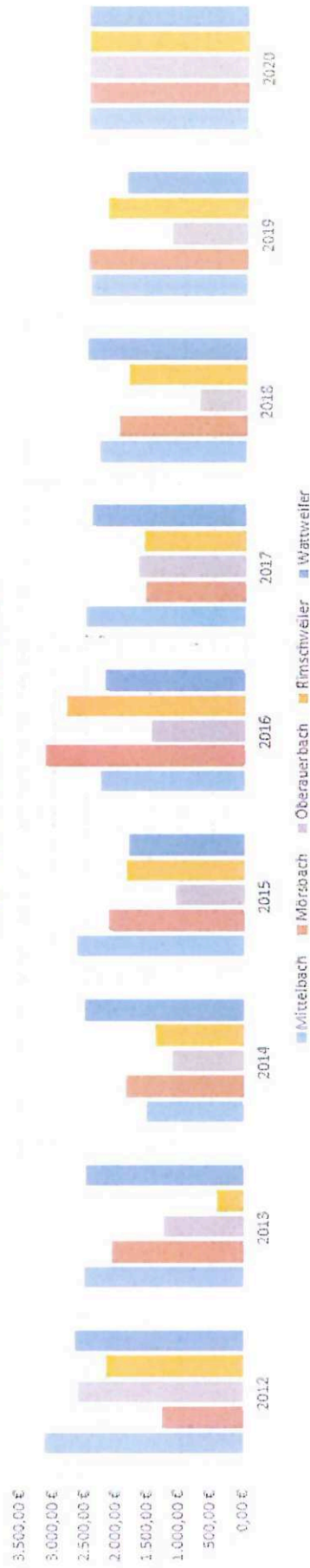
Verfügungsmittel der Gemeinderäte